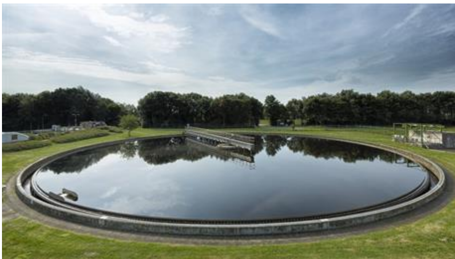
Rioolwaterzuivering in Echten

Water dat ecologisch gezond is heeft een zelfreinigende werking. De ChristenUnie wil een waterschap dat zorgt voor een natuurlijke inrichting van het watersysteem. Bij het onderhoud van de watergangen moet het waterschap ook oog hebben voor het planten en dierenleven.