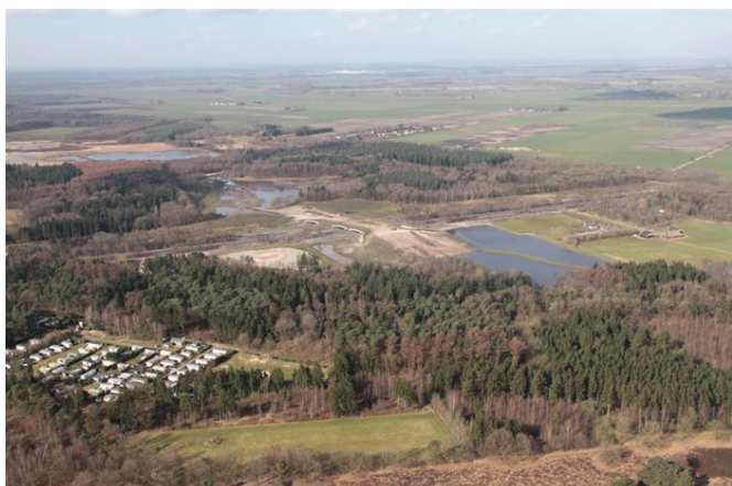
Luchtfoto Dwingelderveld

De ChristenUnie wil dat het waterschap in een vroeg stadium bij de ontwikkeling van ruimtelijke plannen wordt betrokken. De ruimtelijke keuzes die door provincies en gemeenten worden gemaakt zijn soms niet te verenigen met een doelmatig waterbeheer. Om te voorkomen dat het waterschap dan extreem hoge kosten moet maken, zal hier worden aangedrongen op de wijziging van die ruimtelijke bestemmingen.